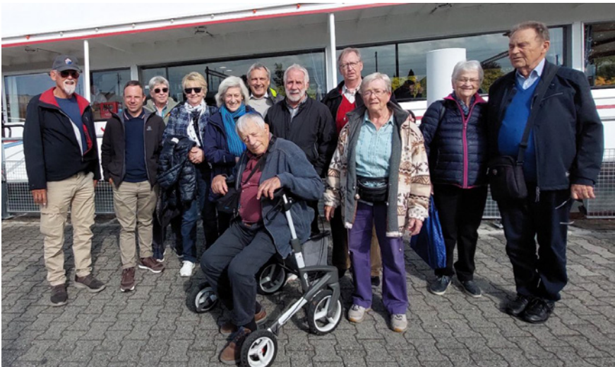
Vorstandsausflug vom 13. Oktober 2025