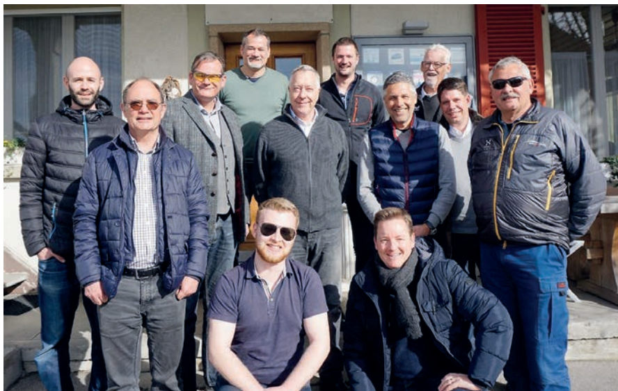
Die beiden Gruppen Bat von Wattenwyl 1 und 2