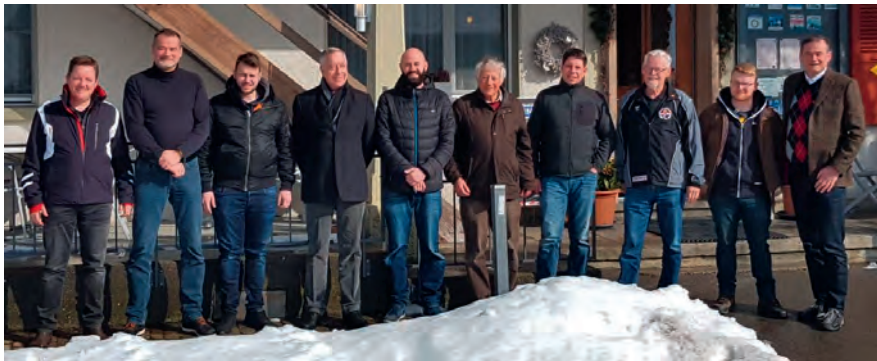
Gruppe Bat von Wattenwyl