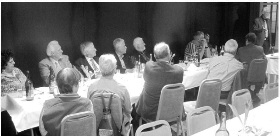
konzentrierte Zuhörerschaft ...